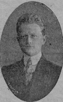
MR. WALTER C. THURSTON Encargado de Negocios de E. U. U. en Costa Rica

El 4 de julio es una fecha memorable no sólo para el pueblo norteamericano sino para todos aquellos pueblos que gestaron, viven y se desenvuelven en las disciplinas constructivas de la democracia, el deber y la libertad. Ciento cuarenta y cinco años se cumplen hoy de la declaración de independencia de ese pueblo rico, pujante y progresivo donde surgieron Emerson, pensador de una filosofía hon-