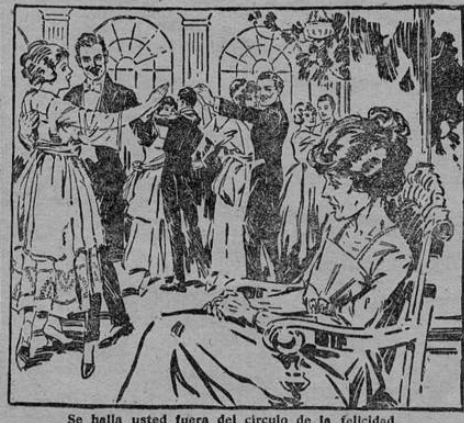
Se halla usted fuera del círculo de la felicidad por falta de robustez? Le faltan a usted Fuerza y Vitalidad para participar en los goces de la vida.

nismo. Toda persona lo dijere con facilidad. En realidad, el HIERRO NUXADO se absorbe tan rápidamente en el organismo y se obtienen tan pronto resultados con unas cuantas dosis, que puede decirse que sus propiedades son semejantes a las del mismo alimento, excepto que proporciona algo que los alimentos no pueden dar: el Hierro en la forma apropiada para el cuerpo humano. Médicos famosos en todo el mundo, han reconocido el inestimable valor del HIERRO NUXADO y lo recetan en abundancia como tónico, vigorizante y restaurador de la sangre, en casos de Anemia, estados de debilidad general, nerviosidad y otras enfermedades originadas por la falta de hierro en la sangre. El hecho de que más de tres millones de personas emplean el HIERRO NUXADO es la mejor garantía de que tiene el mérito que los médicos lo reconocen y tal vez más. De venta en todas las Droguerías y Boticas. Tenga bien en cuenta que la legítima preparación se llama