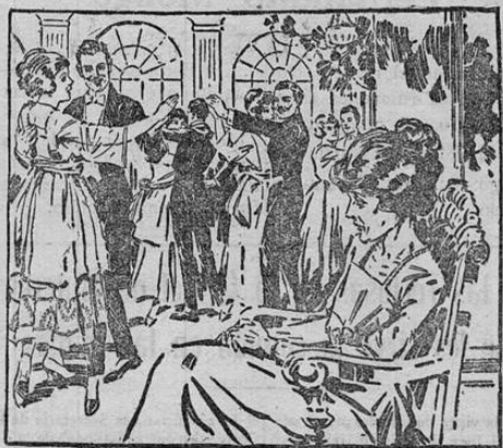
Se halla usted fuera del círculo de la felicidad por falta de robustez? Le faltan a usted Fuerza y Vitalidad para participar en los goces de la vida.

La ciencia ha producido el HIERRO NUXADO el poderoso medicamento que contribuye al bienestar y hace posible en realidad el verdadero goce de la vida. El HIERRO NUXADO es hierro orgánico y vitalizado, de fácil asimilación en la sangre y que obra maravillosamente en el organismo.