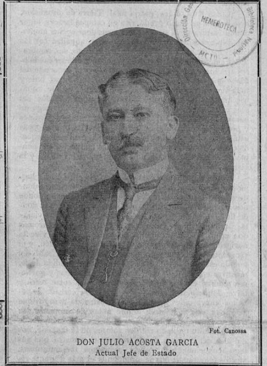
DON JULIO ACOSTA GARCIA Actual Jefe de Estado