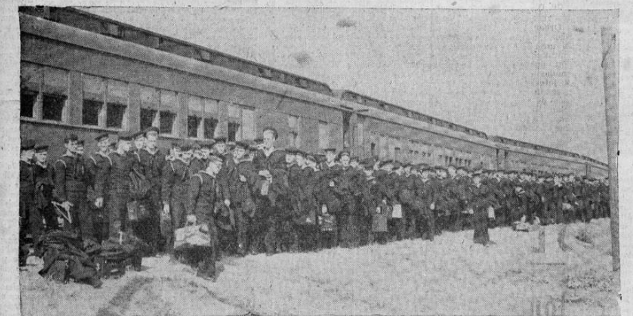
RECLUTAS PARA LA ARMADA AMERICANA.— Este grupo de 365 reclutas de la marina del Tío Sam, fué fotografiado a su arribo a Los Angeles, de paso para la isla Terminal, donde está ubicada la flota en que prestarán servicio. Tío Sam, en su programa de defensa contra posibles agresiones y para contribuir a la defensa continental, ha aumentado sus efectivos militares y marítimos.