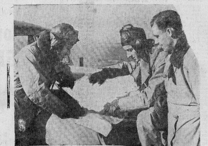
LAS AGUILAS DEL TIO SAM.—Tres pilotos norteamericanos, voluntariamente incorporados a la Real Flota Aérea británica, estudian el mapa del territorio enemigo que se les ha encargado bombardear.

UNA ESCUADRILLA ITALIANA ANIQUILADA. ATENAS, 15. UP. Se informó que los pilotos griegos aniquilaron una escuadrilla completa de aviones italianos derribando diez durante un encarnizado combate.