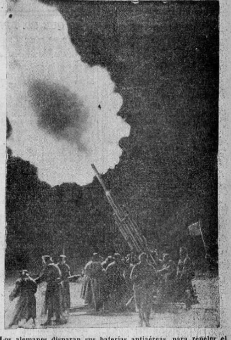
Los alemanes disparan sus baterías antiaéreas, para repeler el violento ataque de los aviones de bombardeo ingleses, que según Londres, han paralizado ya el 20% de la industria germana