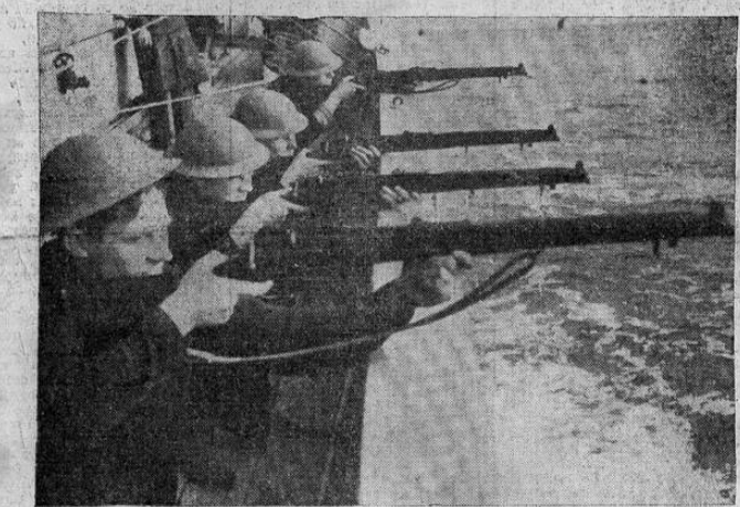
Estos soldados de la remota colonia inglesa del oriente, se preparan a mantener las aguas jurisdiccionales de su país libres de las intromisiones japonesas. Las tropas expedicionarias de esta isla han sido destacadas por Inglaterra en el Levante, para la defensa del Canal de Suez.

De acuerdo con la información especial publicada por el colega matutino LA TRIBUNA, en su edición de esta noche, está dentro de lo posible que en el anunciado próximo viaje del secretario de marina de los Estados Unidos, coronel Knox y su estado mayor a Canal Zone y lugares adyacentes, se determi-