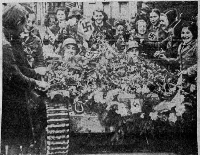
Alemania ha dado vacaciones a sus soldados que prestan servicio en Francia. Las mujeres del Reich reciben como héroes a los que vuelven del teatro de la guerra.