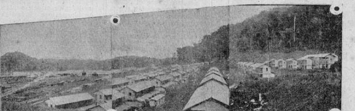
para LA RAZON, dando idea de lo que es hoy el gran puerto de la región sur-occidental de Costa Rica. Puede verse en la extrema izquierda el gran muelle en construcción; luego las bodegas y estación terminal del ferrocarril; el inmenso caserío y a la derecha, recor-