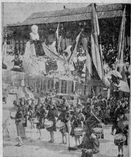
... Dos aspectos de la fastuosa fiesta celebrada esta mañana, con ocasión del bautizo de la Avenida 14 con el glorioso nombre de Domingo F. Sarmiento. Arriba el busto de Sarmiento en la carroza alegórica, mientras la vitoreaba la juventud josefina; bajo, un aspecto del desfile escolar que dió lucimiento al acto organizado por el doctor Louder en la mañana de hoy. (Información en páginas interiores).

WASHINGTON, 20 UP. — Sébase que el departamento de guerra pedirá al próximo congreso la erogación de cinco mil millones de dólares para equiparar un ejército de tres millones de hombres "si tal fuerza se considera necesaria para defender el territorio continental". (PASA a la pág. OCHO)