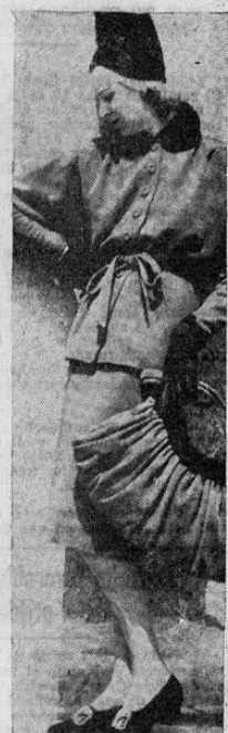
Aun en tiempo de guerra, la moda continúa preocupando a las mujeres. Esta modelo alemana exhibe un vestido de choque tilla tipo mureléjago. Por lo de más, el aspecto revela la influencia militar.

He aquí un nuevo producto de la Fábrica Nacional de Licores: la Crema de Mances. Se trata de una de las más jugosas frutas de nuestro trópico y tiene el sabor inconfundible de la vida de nuestro campo. La crema de mance es inimitable. Y su elaboración es tan cuidadosa que hace que constituya una filigrana de sabor. Entre los licores nacionales esta crema es de lo más exquisito. Sirve en todas partes. Puede ser consumida en la mesa más rica como en la más pobre. No es propiamente un licor sino una golosina líquida.