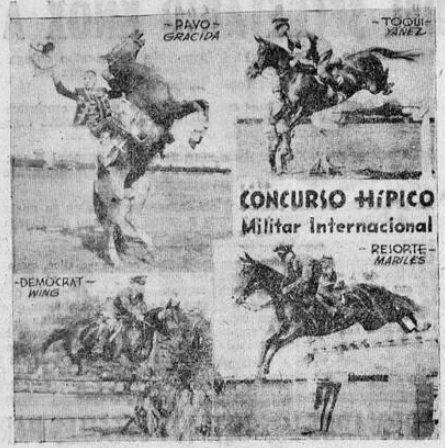
(PASA a la pág. CUATRO)

UN CRONISTA DEL "HERALD TRIBUNE" TRAS DE ADMIRAR LA HABILIDAD FANTASTICA DEL CABALLO, PROPIEDAD DE AVILA CAMACHO, EXPRESO: "ESTE CABALLO HACE DE TODO. LO UNICO QUE LE FALTA ES ENCENDER UN CIGARRILLO".