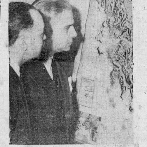
Los oficiales del ejército griego no están más preocupados que los altos funcionarios políticos de su patria. Aquí vemos examinando el mapa del teatro de la guerra, el ministro griego en Washington, Climon Diamantopoulos, y al canciller S. Koudouriotis.