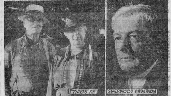
Sherwood Anderson, ilustre novelista norteamericano que acaba de publicar un nuevo libro titulado MI PUEBLO. Anderson lleva escritas arriba de una docena de obras memorables, casi todas sobre el tema de un hombre modesto, que alega son los cientos sólidos de la democracia.

El hombre nacido en esta fecha por lo general es una persona muy respetada a su hogar. Siempre busque el bien en todo el mundo, y si sería feliz. Su nombre, se dará a conocer como catador, escritor, abogado, astrónomo, actor, periodista o gerente de ventas.