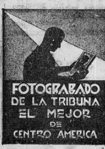
FOTOGRAFADO DE LA TRIBUNA EL MEJOR DE CENTRO AMERICA

tendidos ante la actitud de Rusia y algunas palabras de simpatía le son, dedicadas a este país. El resto de la opinión mundial condena la agresión contra Finlandia. Dos aviones británicos de combate atacan y derriban en las costas orientales inglesas un gran aparato de bombardeo Dornier del ejército alemán. Dos hombres de su tripulación se lanzaron en paracaídas salvándose. Tres perecieron abrasados.