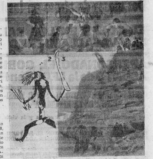
1).—Los hombres de la raza Cro-Magnon del Paleolítico Superior, pintaban en las cavernas animales como invocación religiosa que inspiraba el acto de la caza. 2).—Pintura dinámica rupestre del período Paleolítico más reciente. (Unos 20.000 años). 3).—La caza del oso de las cavernas fué una de las fuentes principales del alimento durante todo el período Paleolítico. (De 20 a 50.000 años).

Frobenius, el genial antropólogo fallecido en octubre de 1938, se dedicó desde hace unos veinticinco años a descubrir de este arte. Durante sus doce excursiones desde la Península Ibérica al Sur de África (las doce DIAS DE Frobenius) el investiga dor pudo encontrar vestigios y argumentos que le sirvieron para lanzar una afirmación que fué calificada de dinamitazo antropológico. "Las culturas paleolíticas de España — decía Frobenius — sin duda fueron el origen de las civilizaciones prehistóricas de África, cuyos récurer Pasa a la pag. TRES