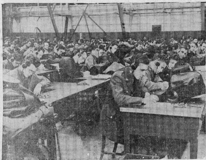
He aquí algunos de los 500 radiotelefonistas aficionados que se están preparando en la escuela para operadores de radio establecido en Scott Field, en Belleville, Illinois