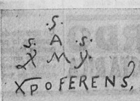
La firma del Almirante.

Tanto se ha escrito sobre Colón que pareciera haberse agotado todos los argumentos para seguir ensalzándolo, comentándolo y denigrándolo. Pues quiz Colón haya sido el hombre más glorioso sobre la tierra y el más afortunado en su alma por la ingratitud de los hombres. Se le ha encontrado descendencia de incendiarios y de ladrones, se ha dudado de la veracidad de su nombre, se le ha tratado de renegado de su patria, de embustero y de ladrón. Si en vida fue objeto de incomprensión y reducción a vasallaje, después de cuatro siglos de su muerte, no se ha habido quien a título de ser discutido y admirado, no se haya desatado contra él, con las más infamantes acusaciones. De seguir así, con el tiempo se llegará a afirmar, como se ha intentado ya con Napoleón, de que Colón ni siquiera ha existido, y que el descubrimiento de América no es más que un suceso mitológico, ideado por la fantasía de algún poeta rampón y chabacano.