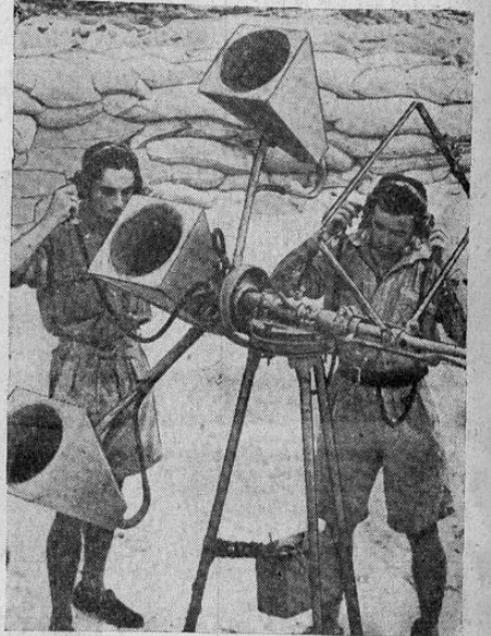
Un aparato descubridor de sonido con el que se escucha atentamente la proximidad de los aviones enemigos, es empleado por los ingleses en el desierto de Libia. Otros servicios de la defensa anti-aérea que acompaña a las tropas las constituyen las baterías de reflectores eléctricos y los cañones anti-aéreos de tiro rápido.—Fotografía aprobada por el censor inglés.

APARATOS Y SEÑALES MODERNAS EN EL DESIERTO