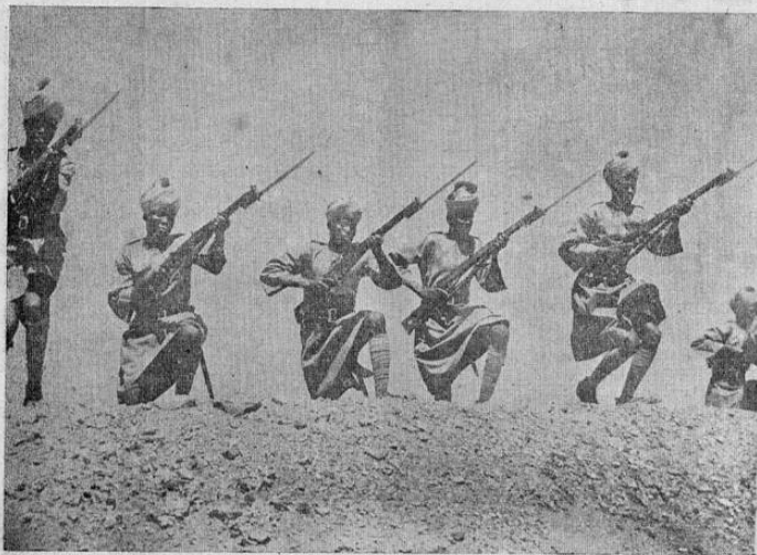
La fuerza de defensa de Sudán, está formada por sudaneses, intrépidos soldados, con oficiales británicos y nativos. Esas fuerzas están siendo velozmente extendidas y muchos reclutas están sometidos a entrenamiento.—La foto muestra soldados sudaneses en prácticas de bayoneta

ALGUNOS DE ESTOS PUEDEN LLEVAR HASTA 50 HOMBRES Y AL SER SOLTADOS POR LOS AVIONES EN PLENO VUELO CAERAN SILENCIOSAMENTE EN INGLATERRA. — SE CALCULA QUE LOS ALEMANES PODRIAN ENVIAR ASI EN UNAS CUANTAS HORAS DOS DIVISIONES COMPLETAS A LA GRAN BRETAÑA CON SU EQUIPO