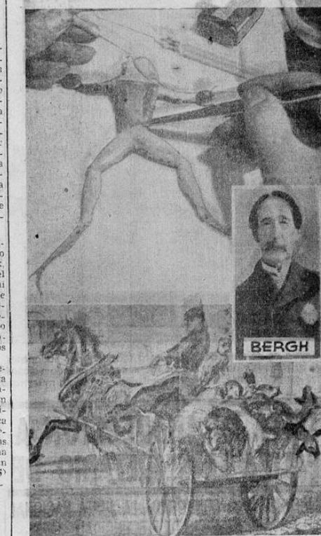
Henry Bergh, fundador de la Sociedad Protectora de Animales de los Estados Unidos. Aparecen en este grabado, dos ilustraciones de los casos que venían ovejales al matadero; una porte antes de la intervención de Bergh.

donde el hombre, después de luchar por la conquista del dólar, triunfa y al final de su gloria, deja la fortuna para aliviar al desvalido. Y nadie puede dudar que esta falsa reputación del materialismo americano está en contraposición con los hechos: si hay una inundación, Norteamérica manda recursos; si se trata de una epidemia, envía médicos; una reclamación diplomática. El consul americano hubo de abandonar su puesto en Rusia y regresar a su patria dispuesto a luchar por el bien de los irracionales. Por este acto de humanismo nació la primera Sociedad Protectora de los Animales. Hoy en los Estados Unidos ella celebra el Jubileo de Oro a fin de glorificar el nombre de Mister Bergh y como recuerdo de este hombre, que fundó uno de los movimientos sociales más importantes del siglo XIX.