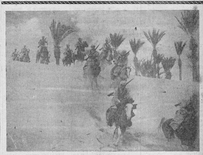
rogante e intrépidos hombres, para quienes la libertad es el aliento de la vida. Después del colapso de Franco, cabalgaron desde Siria, y se unieron a las fuerzas de la Francia Libre, bajo el mando del general de Gaulle. Lanzándose como águilas, los Spahis espolean a sus caballos árabes en el desierto.

EL CAIRO, 21. — Las fuerzas motorizadas del general Wavell avanzan en forma sostenida a través del desierto, en dirección a Trípoli, capital de Libia, mientras simultáneamente se intensifican las ofensivas en Etiopía y la Somalia italiana. El general sir John Dill, jefe del estado mayor imperial y el ministro de guerra Anthony Eden, poco después de su llegada de Londres, iniciaron las conferencias con los dirigentes británicos locales. Se informó que Dill confirió con el general Wavell y ambos prepararon el programa de acción para las operaciones de primavera y para poner término lo antes posible a la campaña en África. Al parecer, la columna nativa que hace tres días tomó Darghela, avanzó a ra-