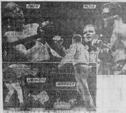
(Arriba) El final del encuentro entre Max Baer y Lou Nova, celebrado en 1939. Nova ha destruido la cara de su adversario y lo tiene en tal mala condición, que el árbitro dejó por terminadas las hostilidades. El "vitalista" de California insiste en que el espectáculo se repetirá cuando se vuelva a encontrar en Madison Square Garden el 4 de abril. (Abajo) El primer encuentro Jenkins-Ambers terminó de la manera que se ve en la fotografía. Jenkins espera anotarse idéntico éxito el 28 de febrero.