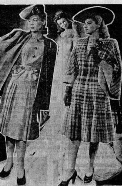
UN TRAJE de novia, uno de calle y otro de excursión de la reciente exposición neoyorquina.

En los trajes se trata de recuperar la silueta del cuerpo largo y la gracia del pelo que intentaron revivir los elegantes de Londres en el Parque de la Regencia a fines del siglo XVIII. Mucho tono púrpura y ciruela. morada. Dibujadas y construidas en la Séptima Avenida, se han presentado estolas de estilo bizantino, fuertemente recargadas con simbólicos adornos de metal, que parecían trajes de las colecciones de un sultán o escapadas de las mil y una noches. Mangas. Se han presentado con mucho éxito en todo tipo