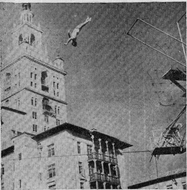
Larry Griswold, el campeón británico de zambullido haciendo sus ejercicios en el estanque del Miami Baltimore en Florida. Ahí lo tenéis después de haber saltado del trampolín y camino del agua.