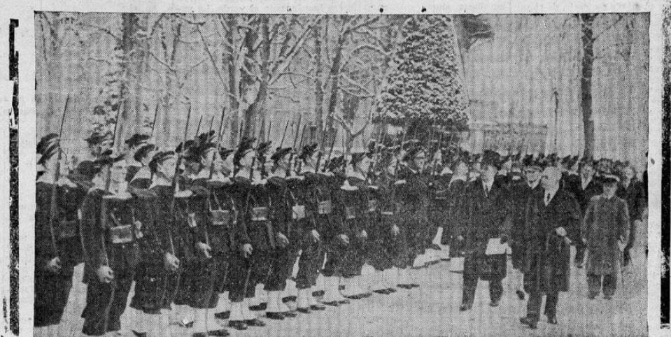
Los marinos de la flota francesa, que son la carta más fuerte del Mariscal Petain