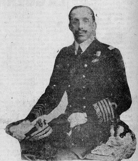
ROMA, 2.—UP.—Murió el ex-rey de España, Alfonso XIII.