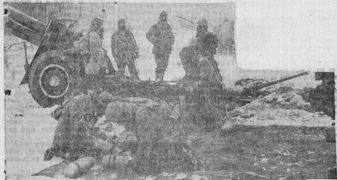
Artilleros de la 44ª División del ejército de Estados Unidos, sirviendo una batería de Howitzers, se aprestaron a las condiciones reales de la guerra, empleando máscaras contra gases, durante las maniobras recientes en Fort Dix, Nueva Jersey, en las que hicieron estudio de modernas tácticas en bosques cubiertos por la nieve, cuando fueron "atacados" por el 174º de Infantería

Todo San José se está alistando para asistir al estreno de "Convoy" como la película más sobresaliente y atractiva de cuantas se han visto en Costa Rica en todos los tiempos.