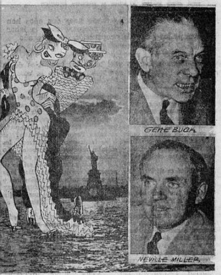
La Rumba aparece sobre la "Estatua de la Libertad" en tanto que Mr. Buck y Mr. Miller luchan en los tribunales por mantener su "monopolio de la musica".

Como funciona la ASCAP. La Sociedad de Compositores.