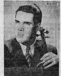
Angel Reyes, el eminente violinista cubano que debutó con brillante éxito en el Carnegie Hall de Nueva York

la aprobación, siquiera bajo formas discretas, de su inteligente auditorio, es empresa reservada a los príncipes del arte.