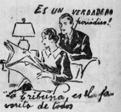
ES UN VERDADERO periodista! "La Tribuna" es la favorita de todos

Para muy pronto "Luna de Miel" por Ginger Rogers, Ronald Colman; "Convoy" por Clive Brook; "Armonías de Juventud", por Mickey Rooney; "No, No, Nannette", por Anna Neagle; "Desfile de Primavera", por Diana Durbin; "Carta de Azul", "Cachito de Cielo", "Ojos Negros", "Camino del Frente", "Allá, en el Trópico", "Mi Madre cita", etc., etc.