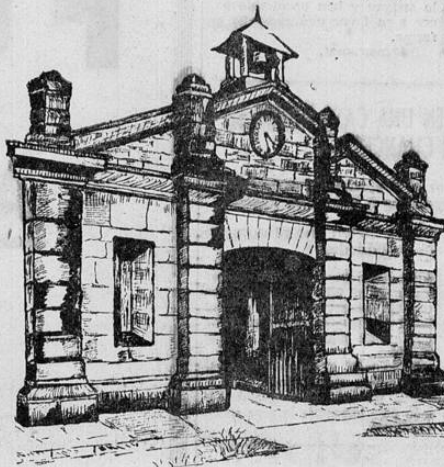
FABRICA NACIONAL DE LICORES

Precios: Por menor ¢ 3.30 — Por Mayor ¢ 2.30