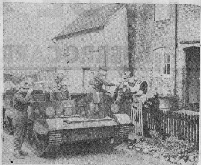
La comodidad de los aldeanos "en un pueblo inglés" evita a los Royal Scots de Servicio el tener que dejar sus tanques para tomar una taza de té cuando les llega la hora.