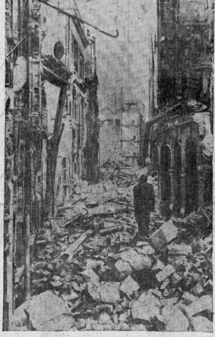
ASI QUEDO EL CENTRO DE LONDRES

El distrito de Aldermanbury en Londres, uno de las más viejas secciones de la ciudad, fué víctima principal de los furiosos raids con que Alemania puso fin a la "tregua" de Navidad. Esa región fué destruida por completo. Las llamas surgidas de centenares de bombas incendiarias y exclusiva radiotelefonos no presenta el estado en que quedó una de las antiguas y angostas calles, llena de escombros