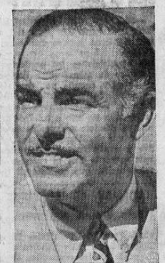
ANTONIO MORENO Hollywood se olvidó de que podía hablar inglés

Las muchas películas en español que hizo en Hollywood fueron versiones especiales de atracciones como "El Hombre Malo" y "El Gato y El Canario". El proyecto entonces era el de contratar un elenco enteramente latino que seguiría al norteamericano, empleando los mismos sets y traducciones de los ar