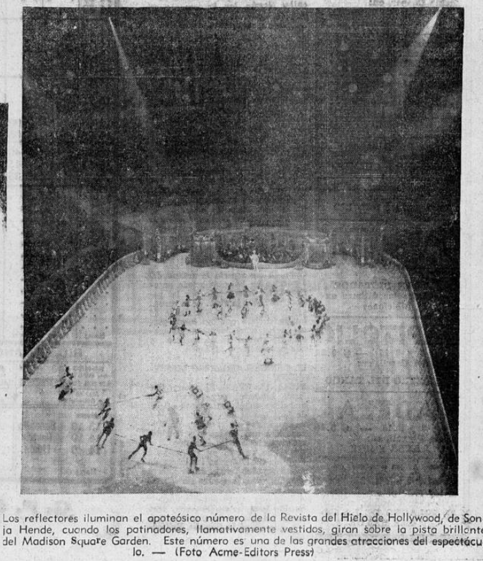
Los reflectores iluminan el apoteósico número de la Revista del Hielo de Hollywood, de Sonja Hende, cuando los patinadores, llamativamente vestidos, giran sobre la pista brillante del Madison Square Garden. Este número es una de las grandes atracciones del espectáculo.