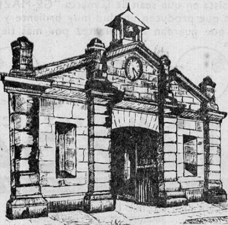
FABRICA NACIONAL DE LICORES

Resulta indispensable en todo buen coctel. Con los otros licores de la Fábrica produce magníficas combinaciones.