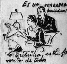
ES UN VERDADERO BENEFICIO! "Nuestro País" es la fuente de toda EFEMERIDES...

Un libro como este que para dar datos geográficos de Escasú nos presenta una lectura titulada "A comer espumas: los trapiches", y que cuenta el valor del pasaje del camión y que da nombres reales y que encuentra a los hombres en función de su actividad.