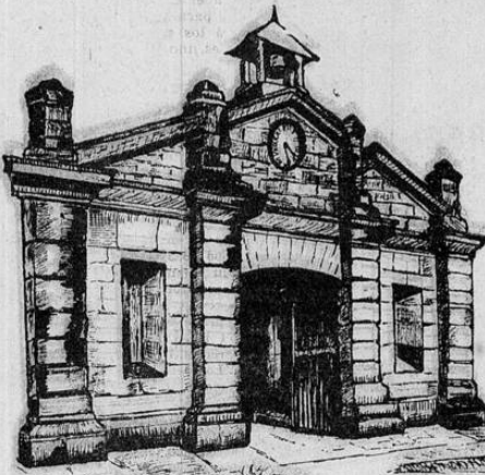
FABRICA NACIONAL DE LICORES

Resulta indispensable en todo buen coctel. Con los otros licores de la Fábrica produce magníficas combinaciones.