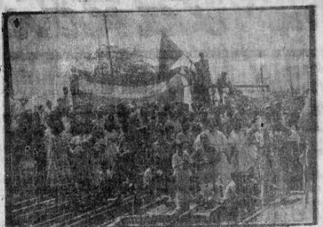
En Puntarenas una gran multitud de gentes del pueblo organizó una manifestación de simpatía hacia las democracias una vez consumado el acto por los marinos del eje al dar fuego y tratar de destruir los dos navios, Eisenach y Fella, refugiados en la bahía. Los manifestantes, como se ve, desplegaron banderas de Costa Rica y de la Gran Bretaña.