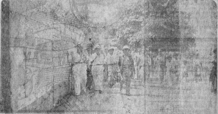
Altos oficiales de los buques incendiados, en el momento de ser trasladados a la Y Griego, para su traslado a bordo de un tren expreso, a San José. Véase a su lado al Coronel Rodríguez Torra. (Foto de Castilla en viaje especial a Puntarenas).