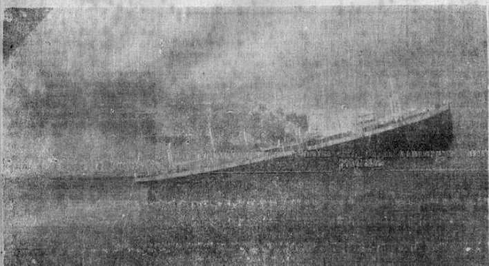
Mientras el avión que condujo a nuestros redactores a Puntarenas volaba sobre el "Eisenach" en llamas, Castilla captó este magnífica gráfica del impresionante momento en que el mercante alemán lanza al aire sus llamaradas y su columna negra de humo. Al extremo superior derecha véase una parte de la ala del avión que condujo Pizarro.