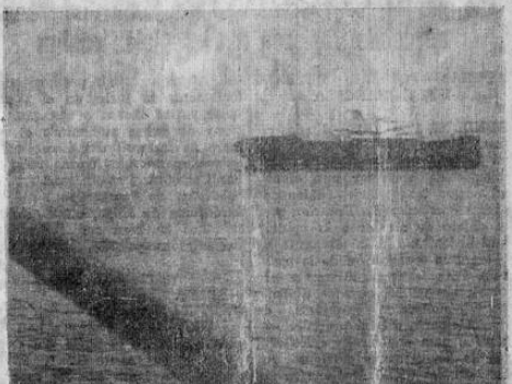
Un tanto corano de estribor, el navío alemán Eisenach en la rada de Puntarenas, una vez que el fuego había disminuido a bordo. Desde el principio de las hostilidades en Europa este barco buscó refugio en nuestro puerto del Pacífico en donde ha estado; sus marinos venían con frecuencia a esta capital en donde pasaban días en casas de familia de la colonia alemana o en hoteles públicos.

En las esferas diplomáticas circula la versión no confirmada de que Italia mediaría entre Alemania y Yugoslavia.