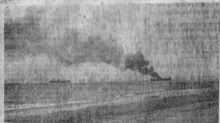
La motonave FELLA pasto de las llamas. Como se veía desde la playa, en los momentos en que ardía a las diez de la mañana. Una columna de humo negro manchaba todo el cielo de la mañana portuaria.

tos por pocos puntos de ventaja, y de allí el interés de los liceístas por ese juego de revancha. Los equipos se presentan en las mejores condiciones y dispuestos a ofrecer una buena exhibición de basket ball.