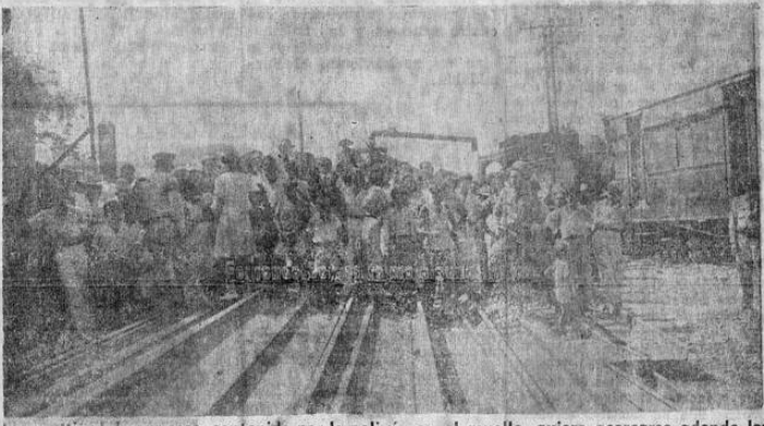
Una multitud de curiosos, contenida por la policía, en el muelle, quiere acercarse adonde los marinos son embarcados rumbo a San José.