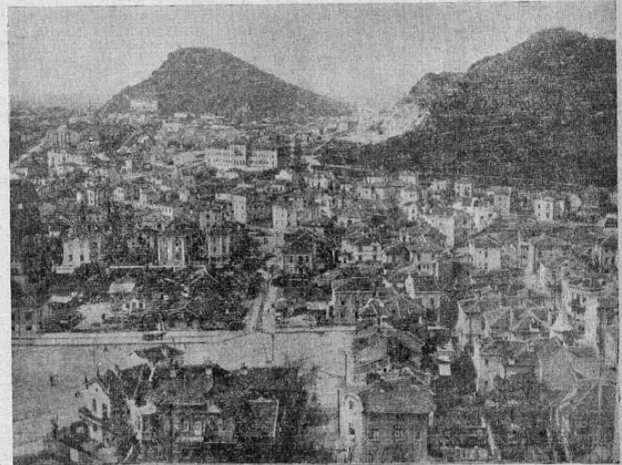
Vista de Angora, la moderna capital de Turquía.