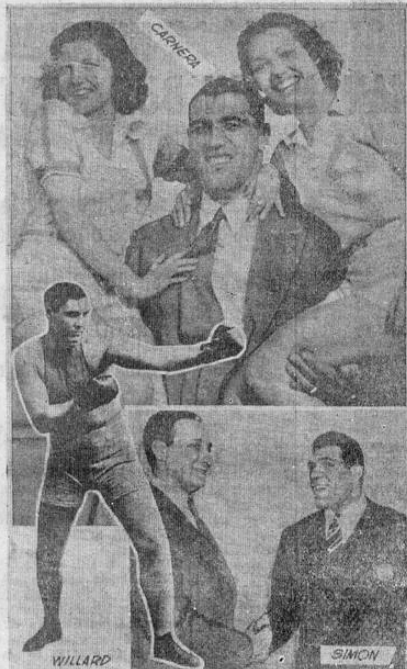
(Arriba) El gigante Primo Carnera, en la época en que era campeón del mundo, demostraba sus enormes fuerzas por el procedimiento de sentar en sus brazos a dos muchachas bonitas. — (Abajo, izquierda) Jess Willard en los días de sus grandes triunfos. (Derecha) El atleta de Long Beach, al parecer subido en una silla, cambia un apretón de manos con Abe Simón—el gigante de moda—tras de colocarle en el pecho la chapa o insignia de jefe de la policía de la populosa playa neoyorquina.

Pero Abe Simón, como Jess Willard, no había sido derribado nunca hasta que se enfrentó con los puños de un pegador excepcional. En el caso de Willard fué Jack Dempsey; en el de Simón, Joe Louis.