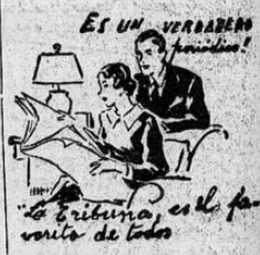
ES UN VERDADERO familia! La biblioteca, es la fuente de toda

Estos resultados se verán en parte en la exposición del Campo Ayala.