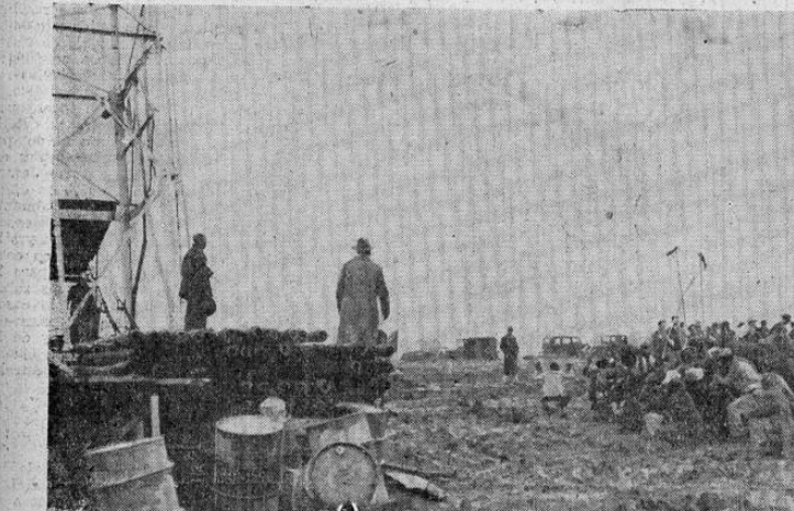
Este grupo de negros de Cunej, Tejas, arrendaron sus tierras a una compañía petrolera con objeto de hacer exploraciones en busca de petróleo. Antes de darse comienzo a los trabajos, los negros se arrojaron pidiendo al Señor que la empresa tuviese éxito.