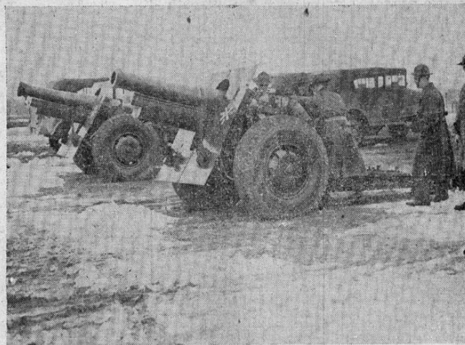
Fuerzas norteamericanas del regimiento de Artillería de Compañía 176, hacen ejercicios de tiro de cañón en Fort G. G. Meade. Estos modernos howitzers usan proyectiles de calibre 155 mm.