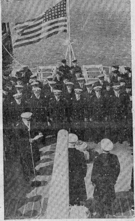
La marina de guerra de Estados Unidos cuenta de día en día. En la foto vemos un grupo de oficiales en la ceremonia de entrega del nuevo destructor Ericsson a la flota norteamericana.