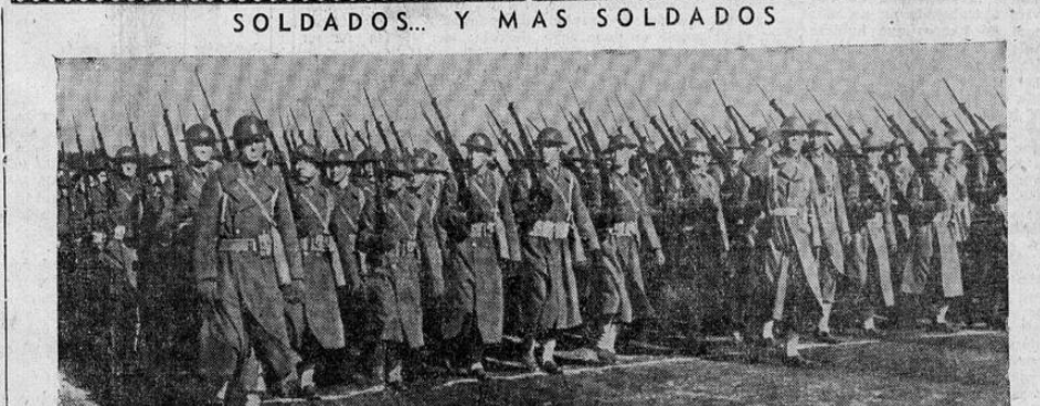
No cabe duda de que los Estados Unidos se preparan para la guerra. En la foto podemos ver miles de soldados completamente equipados en desfile ante el gobernador A. B. Langlie del Estado de Washington. —