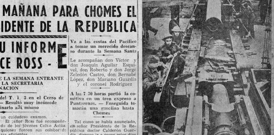
Un cañón de nueve pulgadas, situándose en posición en un lugar de Inglaterra, seleccionado por el mundo para combatir una posible invasión