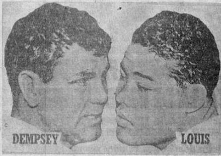
Estas son las testas de Jack Dempsey y de Joe Louis a los 24 años, época en que avanzan con la plenitud de su gloria. — Louis derrotó a Max Schmeling limpiando de ese modo el gran borrón de su record. — Dempsey le arrebató a Willard el título y venció a otros cinco adversarios, todos en el primer round.

LA OPOSICION QUE LE HIZO FRENTE AL CICLON DEL LAGO SALADO MUY SUPERIOR a la QUE HA CONFRONTADO EL BOMBARDERO DE DETROIT — MORRIS, FULTON, BRENNAN Y WILLARD ERAN SUPERIORES A CARNERA, BAER, SCHMELING Y BRADDOCK