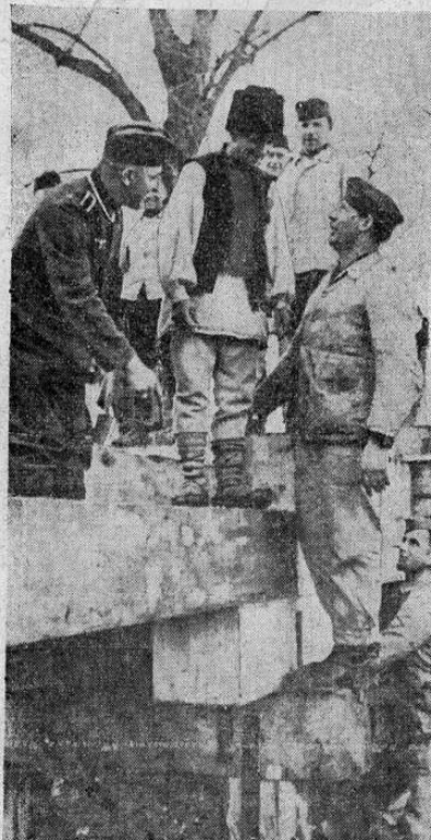
Soldados alemanes del cuerpo de ingenieros refuerzan un puente sobre el Danubio preparando el camino a las columnas motorizadas. Un campesino rumano en charla con los soldados alemanes.