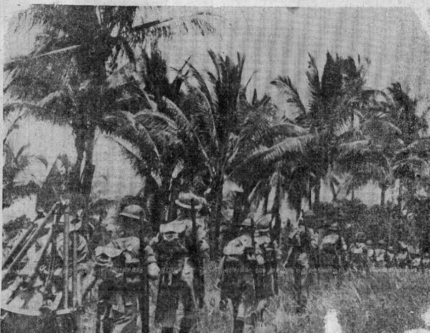
Soldados ingleses durante recientes maniobras en la plaza fuerte del llamado "Gibraltar del Pacífico", atraviesan la selva en las proximidades de Singapur para reforzar las tropas de defensa.

Vecinos del barrio de Otoya nos manifiestan que después de estar complacidos con el loable propósito de los encargados de la Municipalidad para plantar arbolitos a ambos lados de las calles 11 y 13, Avenida B, sienten tener que decir respecto del deplorable sistema de abonar los huecos en que van a ser sembrados 26 arbolitos, la funesta consecuencia resultante: Se ha generado la vida a millones de moscas que inundan ahora las casas vecinas. La causa es atribuible al hecho de haber echado basura fresca recogida de la población el mismo día, y de no haber pisoneado la tierra que tapa los huecos. Las cámaras de aire formadas por la poca compactibilidad de que permite la mezcla de cáscaras de frutas cítricas, de pepes y otros desperdicios de difícil amalgamación, han dado alojamiento a que larvas innumerables se desarrollen rápidamente con la cooperación del aire que ha penetrado por los espacios de los terrones que cubren los huecos. Urge la aplicación de mangueras para humedecer la superficie y al hecho de haber echado basura fresca recogida de la población el mismo día, y de no haber pisoneado