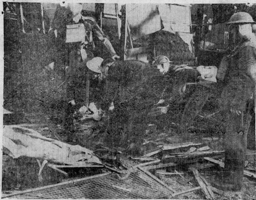
Miembros del Cuerpo de Salvamento de Londres extraen de las ruinas de una estación de ferrocarril de la capital inglesa, las víctimas de uno de los recientes bombardeos nazis.

Es posible que se le introduzcan algunas reformas al original, que elaboró el Servicio Nacional de Electricidad