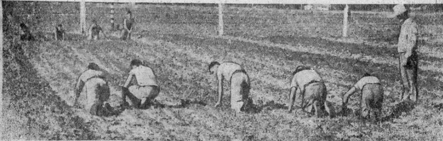
Niños de la guardería de San Fernando, California, dirigida por frailes franciscanos, aprenden desde edad temprana a saber que en la vida solo se recoge lo que se siembra. Esta institución tiene a su cuidado los niños delincuentes.