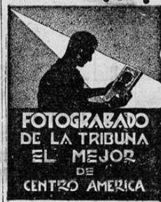
FOTOGRAFADO DE LA TRIBUNA EL MEJOR DE CENTRO AMERICA

Nova supera a Louis en resistencia y en coraje, y en lo que a habilidad boxística se refiere, no es inferior al campeón. La ventaja de éste sobre Nova se la da el poder de sus puños. Pero si ese poder ha mermeado hasta el punto de no ser Louis capaz de tirarlo a la lona y mantenerlo en ella, entonces la corona de Louis no estará muy segura sobre sus sienes.