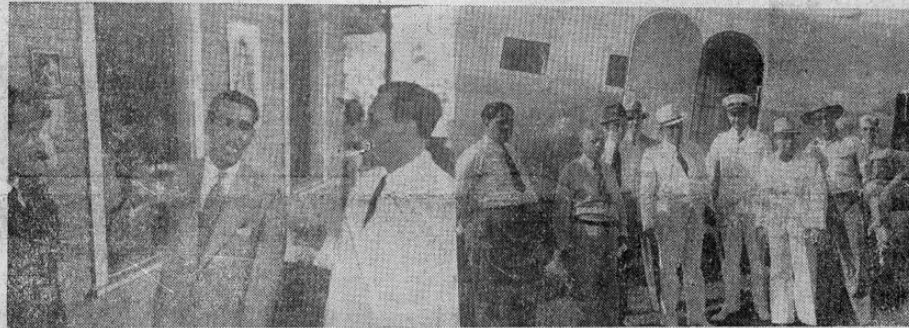
En la entrevista de los presidentes esta mañana en Sixaola: A la izquierda: los presidentes Calderón Guardia y Arias brindan, se abraza por el arreglo a que acaban de llegar. A la derecha el presidente de Costa Rica, Dr. Calderón Guardia.

En mucho tiempo no se ha producido en Costa Rica un hecho histórico de la resonancia del que tuvo lugar esta mañana en el Puente Internacional del Sixaola PASA a la página CUATRO