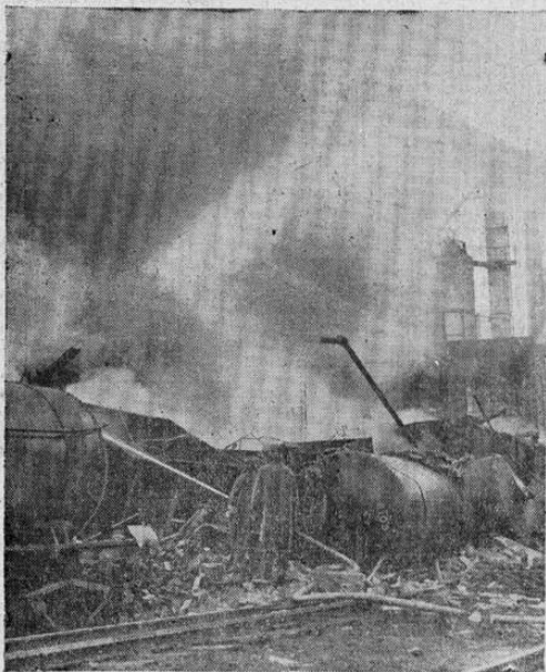
Una serie de explosiones y fuegos ocurridas últimamente a través de Estados Unidos hacen presumir que se trata de sabotaje, y las autoridades están tratando de esclarecer estos accidentes. En la foto, las llamas consumen algunos tanques en la refinería petrolera de Emlenton, Pensilvania.