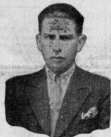
Lic. don TEODORO PICADO, Presidente del Poder Legislativo para 1941

riosa, si no hay cambio alguno, como probablemente no lo habrá. Esta papeleta es la siguiente: