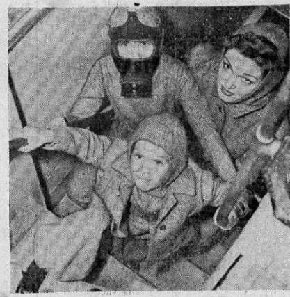
Vista del interior de un refugio en Inglaterra en el que aparece una madre con sus dos niños usando trajes especiales durante el tiempo que dura el raid aéreo. Uno de los niños usa también la máscara contra gases.

El Reverendo Padre don José Turcios, al llegar de retorno al país, se ha dedicado en cuerpo y alma a las obras que tenía en mente realizar, entre las que se cuenta en primer término la escuela de artes y oficios, de la cual se había colocado ya la primera piedra. Ahora mañana, en una ceremonia que tendrá singular esplendor y solemnidad se dará comienzo a los trabajos, haciéndose con tal motivo una procesion o desfile en el que tomarán parte camiones llevando materiales que han sido obsequiados para la iniciación de los trabajos. Los actos tendrán lugar en las horas de la tarde y serán amenizados por la banda del Oratorio. A estos actos ha sido invitado el señor Presidente de la República,