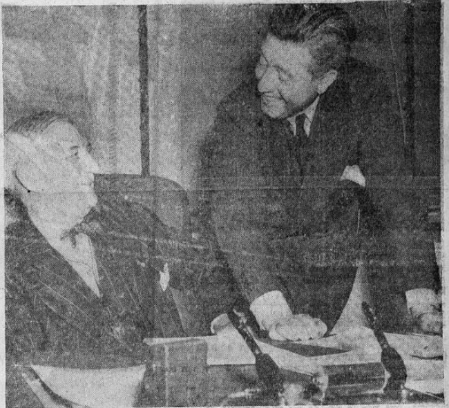
William S. Knudsen (izquierda) Presidente de la Junta de Defensa recientemente organizada en Estados Unidos, informa a Frazier Hunt, comentarista, que "para mediados del próximo verano este país producirá más armas de combate y sus accesorios que todo el resto del mundo". (Foto Acme - Editors Press).