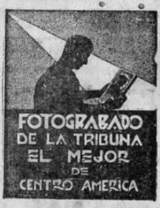
FOTOGRAFADO DE LA TRIBUNA EL MEJOR DE CENTRO AMERICA