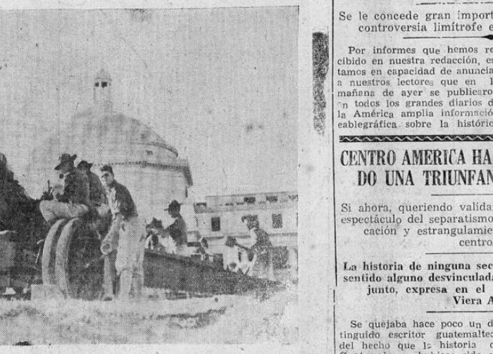
Tropas nativas de Puerto Rico y soldados del ejército regular de Estados Unidos se entrenan en la defensa de la costa y el ciclo boricuas, no muy lejos de la cúpula del Capitolio de San Juan. Este entrenamiento es parte de las extensas maniobras que actualmente se llevan a cabo en el Caribe.

Este documento es propiedad de la Biblioteca Nacional "Miguel Obregón Lizano" del Sistema Nacional de Bibliotecas del Ministerio de Cultura y Juventud, Costa Rica.