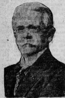
DR. BELISARIO PORRAS