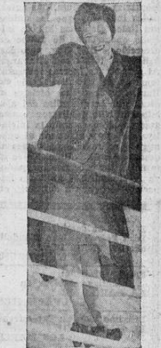
Leonora Corbett, actriz inglesa, en viaje a Hollywood, California, saluda alegre a la estatua de la libertad en Nueva York