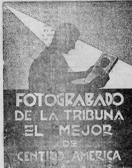
FOTOGRAFADO DE LA TRIBUNA EL MEJOR DE CENTRO AMERICA

ria como consecuencia de la proyectada elaboración de Vichy con Alemania. También se informó que el alto comisionado Henri Dentz informó a los alemanes que no tomará ninguna acción sin órdenes directas de Vichy.