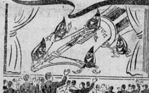
Plumas Parker VACUMATIC con Rombó Azul en el Saldador de Flecha Blanca Garantía Vitalicia

MILLONES ACLAMAN A QUINK LA TINTA QUE EVITA LAS DIFICULTADES DE LAS PLUMAS