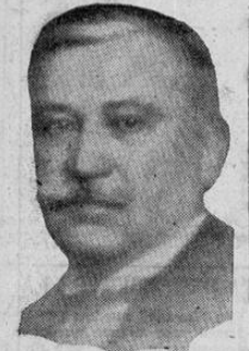
Don JULIO ACOSTA GARCIA

Esta fecha encuentra lleno de energías y de firme voluntad para el porvenir, al ilustre ex-presidente de la República don Julio Acosta Garcia, caballero de grandes merecimientos que con agrado desde muy joven su vida al servicio de la patria.