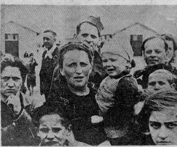
Uno de los más trágicos efectos de la guerra, es el de los más callados son los refugiados. Este grupo de ellos, extrañeros, acampa en Rivesaltes, Francia.