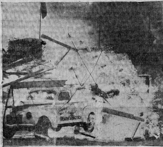
A TRAVES DE LAS LLAMAS

Tito Guizar, en persona, a la media noche de ese día, comenzó las averiguaciones para determinar quién fue el criminal. (Continuará mañana)