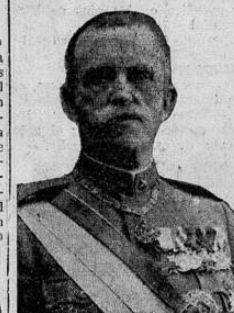
VICTOR MANUEL II