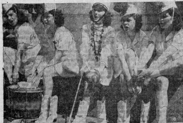
Un grupo de bellas muchachas, conocidas por "majorettes", que suelen ir en Estados Unidos al frente de una banda militar dirigiendo ésta con un bastón que hacen girar de manera prodigiosa, durante un descanso en la parada anual que celebraron recientemente las Escuelas Públicas de Washington.