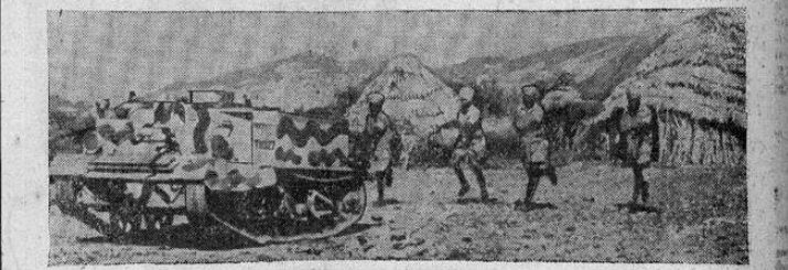
Protegidos por un tanque comufado, los soldados ingleses avanzan en el frente de Eritrea, donde las tropas italianas se hallan en retirada.