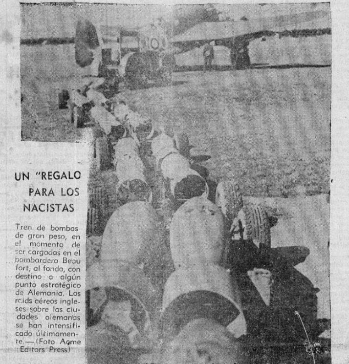
UN "REGALO PARA LOS NACISTAS

VICHY, (FLASH U. P.) 28. —Oficialmente se anunció que Sfax en Túnez francés esta mañana. El vocero oficial agregó que el gobierno de Vichy no encuentra explicación ninguna a este acto de agresión.