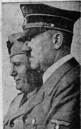
HITLER y MUSSOLINI

ayer al remanente de las fuerzas británicas en las montañas del norte de Creta, donde tomaron tres mil prisioneros.