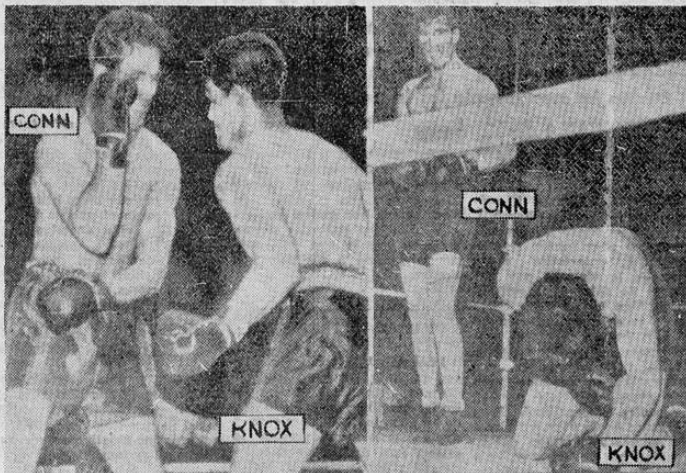
A la izquierda, una pose defensiva habitual del magnífico boxeador Billy Conn. A la derecha, Knox ha caído a la luna a resultas del golpe más fuerte que pegara Conn en su vida. Véase la cara de satisfacción del Apolo de Pittsburgh.

Lo que Conn no puede hacer frente a Louis Fué un gancho de izquierda