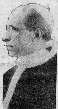
S. S. PIO XII

CIUDAD DEL VATICANO, 2 UP.— Pio XII pronunció el domingo de Pentecostés, ante el micrófono una alocución acerca de los problemas sociales, con (PASA a la página CINCO)