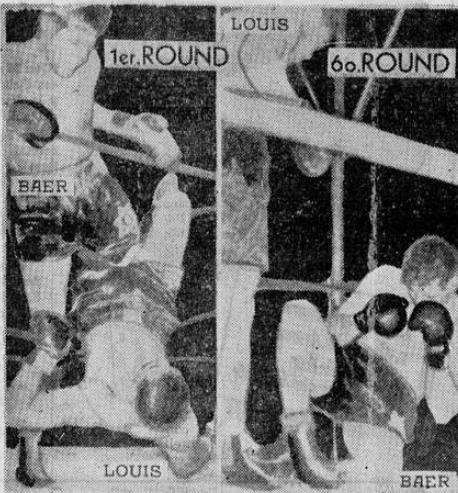
En el primer asalto de la pelea celebrada en Washington el viernes 23 de mayo, Joe Louis se vió obligado a adoptar la incómoda posición que se ve en la fotografía de la izquierda. En el sexto episodio fue Buddy Baer quien se vió de repente con las posaderas pegadas a la resina. Louis ganó en el séptimo "round" por descalificación de su adversario.