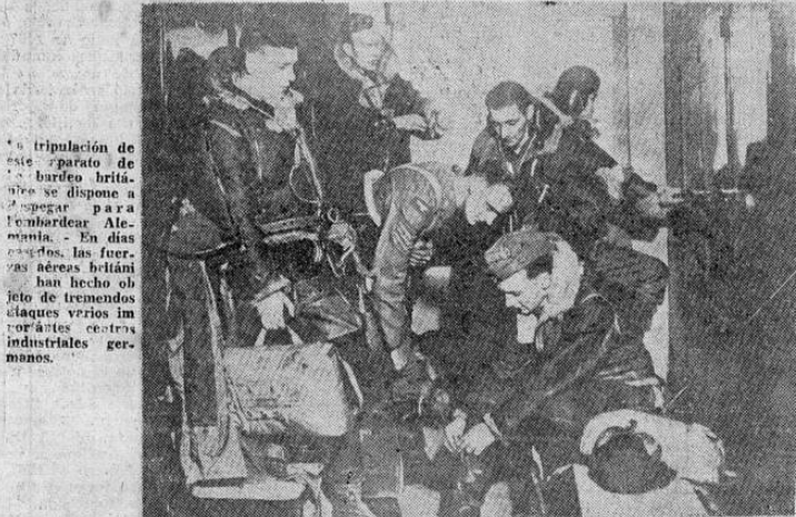
La tripulación de este aparato de bombardeo británico se dispone a despegar para bombardear Alemania. En días sucesivos, las fuerzas aéreas británicas han hecho objeto de tremendos ataques varios importantes centros industriales germanos.