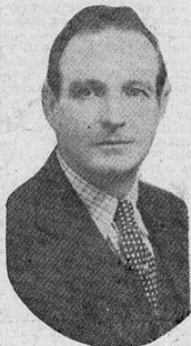
Don TOMAS GUARDIA