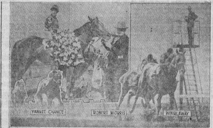
Dos instantáneas de la gran victoria de "Whirlaway" en la carrera Belmont Stake celebrada en Long Island (Nueva York) el 8 de junio actual. Una de ellas reproduce el momento más emocionante de la carrera, cuando "Robert Morris" trató de pasar al vencedor. La otra el momento de la glorificación de "Whirlaway", quinto caballo que gana la triple corona de los Estados Unidos.

En la segunda parte del programa se ofrecerán tres quinielas en las que tomarán parte los siguientes jugadores: 1) Salvador. 2) Ventura. 3) Ramiro. 4) Edgar. 5) Avila. 6) Rodrigo.