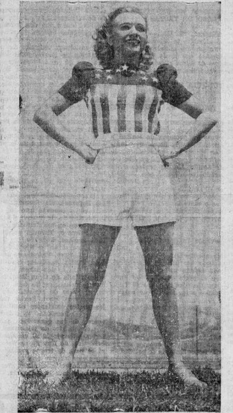
El patriotismo es la nota de la temporada tanto en la ciudad como en las playas de verano. En la foto, la simpática artista del cinema, Priscilla Lane, luciendo un estilo de deportes con las "estrellas y las franjas", que se ha hecho muy popular.