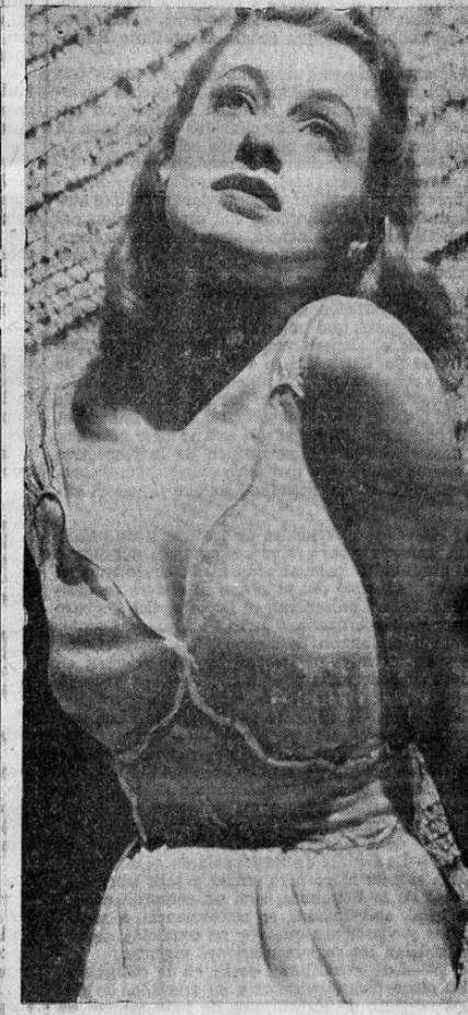
Interesante estudio fotográfico de la estrella de la pantalla, Ellen Drew, en uno de sus poses más características.