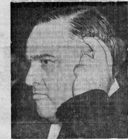
El alcalde de Nueva York, Fiorello La Guardia, durante la "Asamblea para salvar a la democracia", que se celebró recientemente en Filadelfia. El alcalde pronunció en esta ocasión un discurso urgiendo la entrada del país en la guerra.

Hay una iniciativa que estudia la secretaria de educación