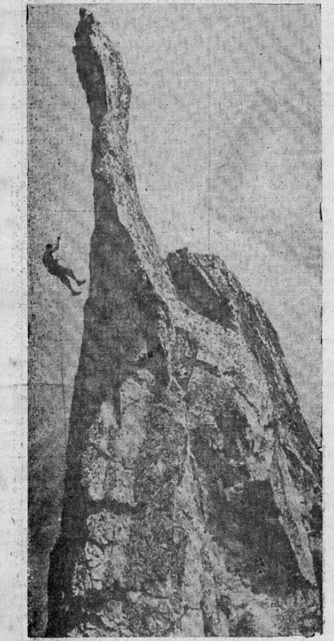
Mientras el resto del mundo vive afligido pensando en la guerra, este escalador de montañas asciende a la cumbre de un pico de los Alpes en Suiza, a donde seguramente no llegarán los ecos de la lucha.