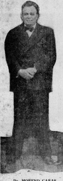
Dr. MORENO CAÑAS