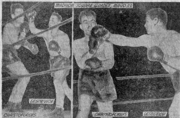
Dos fases del encuentro entre Antón Christoforidis — campeón mundial de la National Boxing Association — y Gus Lesnevich. Lesnevich obtuvo la victoria a los puntos.

Ya en el tercer asalto desahogó Lesnevich un derrochazo en la mandíbula de su adversario cuyos efectos se hicieron visibles. En el octavo "round" volvió a tenerlo mareado y en el último lo puso al borde del K. O. Lesnevich hubiera podido ganar por la vía rápida si hubiera sabido aprovechar sus ocasiones. Pero el pugilista de ascendencia rusa es uno de esos boxeadores que no saben aprovechar su ventaja una vez que tienen al adversario camino de la tierra del sueño. En vez de lanzarse sobre él resultantemente, tratando de repetir el golpe, se dedicaba con toda paciencia a esperar la apertura en su guardia,