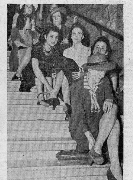
A causa de la reciente huelga de ascensoristas del famoso edificio Woolworth de Nuevo York, los oficinistas que trabajaban en el mismo tuvieron que ascender a pie hasta 40 y más pisos. En la foto, un grupo de lindas muchachas hacen una parada en la marcha forzada.