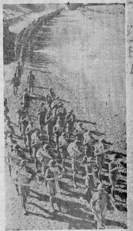
Una banda de 28 músicos, a la cabeza de una columna de las Fuerzas Imperiales Australianas, dan al aire sus notas alegres al cruzar el desierto cerca de la Palestina.

BERLIN, 27 UP. — Las tropas alemanas continúan la vida en las frentes autorizadas contra la lucha iniciada hace seis días contra el coloso ruso y en las frentes autorizadas contra la lucha iniciada hace seis días.