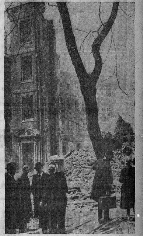
Los hablantes de Londres contemplan las ruinas de uno de los edificios más famosos de la capital que fue recientemente víctima de la Luftwaffe nazi. Se trata del Brick Court, Inner Temple, residencia de los abogados londinenses.