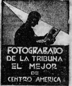
FOTOGRAFADO DE LA TRIBUNA DEL MEJOR DE CENTRO AMERICA