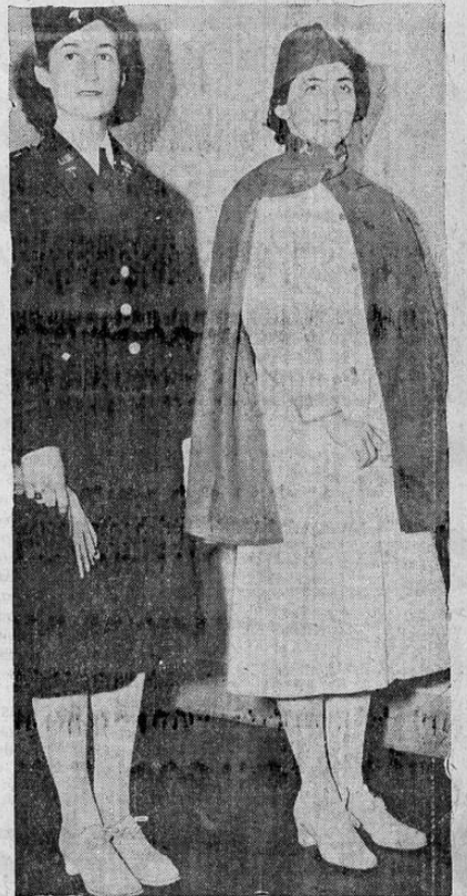
El ejército de Estados Unidos ha adoptado un nuevo uniforme para enfermeras, en vez del que se usó en la guerra pasada, que aparece en la izquierda de la foto. El nuevo uniforme es blanco, con una capa azul.