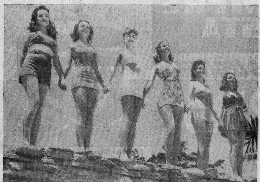
Seis bellas jóvenes californianas, subidas sobre un paredón de la playa, que ofrecen un cuadro tan interesante como atractivo. No es extraño que los marineros que pasan en las embarcaciones a lo largo de la costa tengan tantos deseos por saltar a tierra.