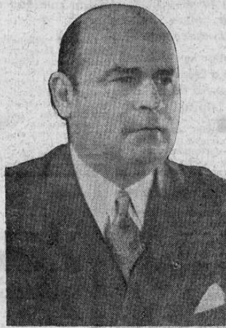
Excmo. señor General ISAIAS MEDINA ANGARITA Presidente de Venezuela