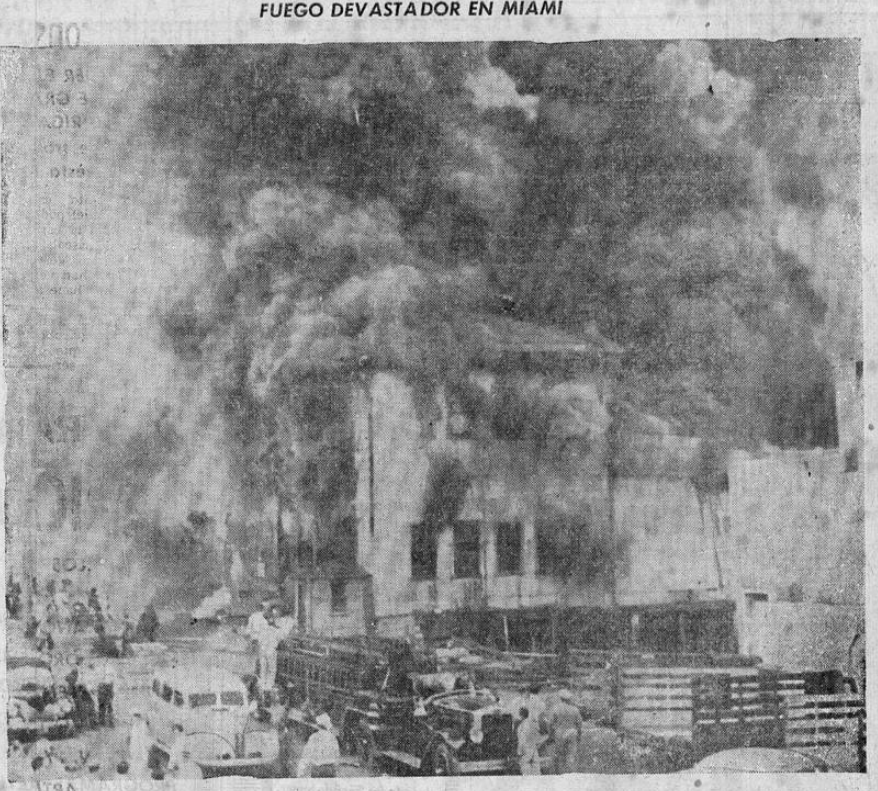
Un incendio de tremendas proporciones se declaró recién en el muelle de la línea de vapores norteamericana Clyde-Malloary. El fuego ocasionó pérdidas por valor de 800,000 dólares. El vapor Seminole, que se encontraba amarrado al muelle, sufrió también averías.