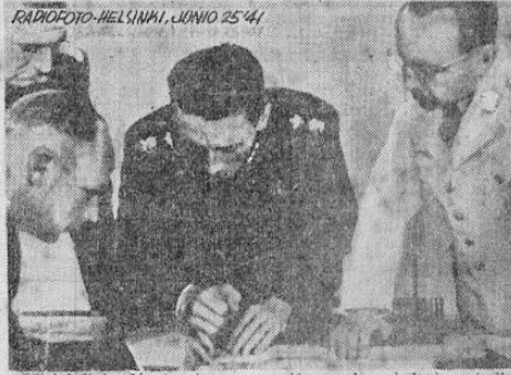
Oficial finlandés (centro, con uniforme de aviador) estudia un plan de operaciones con oficiales rusos, como la que aparece en la foto, han sido incendiados. Pasando sobre las casas aniquilar las tropas, y destruir los tanques.

DE DOS MIL AEROPLANOS AL MES NO PASA LA PRODUCCION EN ALEMANIA; ES FALSO QUE SUS FABRICAS ESTAN HACIENDO SEIS MIL, COMO LO HA DICHO EL MINISTERIO DEL AIRE