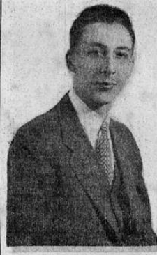
Excmo. Señor Licenciado ALFONSO CARRILLO Ministro de Guatemala