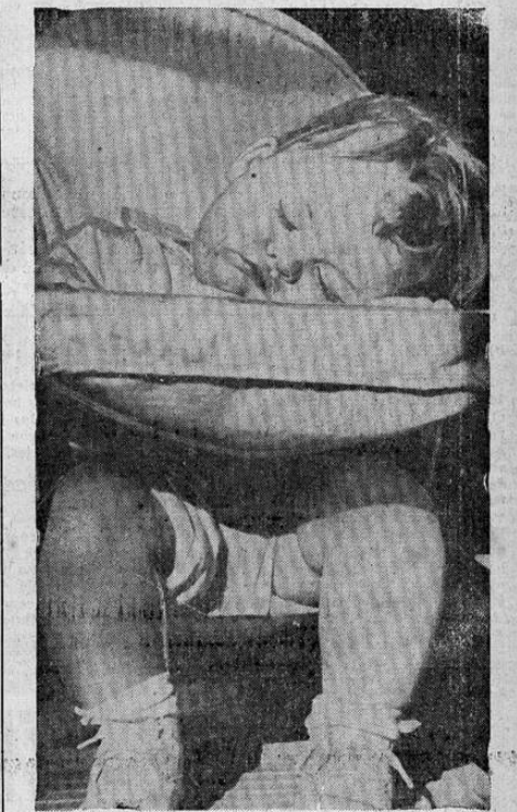
En brazos de Morfeo y sin importarle un darme lo que él puedan decir, este robusto nene acaba de ganar el primer premio en un concurso de "Belleza Dormida", ¡Esto es lo que se llama hacer dinero mientras uno duerme!

Para muy pronto la primera película de audioscopía, en dos rollos, con argumento "Crimen Microscópico". Pronto: "Yo Soy su Marido", "El Secreto de la Monja", "Ccn voy" "Eso que llaman Amor", etc., etc.