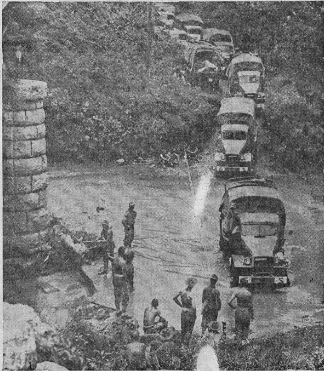
Unidades motorizadas del ejército norteamericano pasando un riachuelo durante recientes maniobras. En este caso, los camiones llevan cocinas ambulantes que dispondrán en un momento la comida para los soldados que se hallan trabajando cerca del puente.