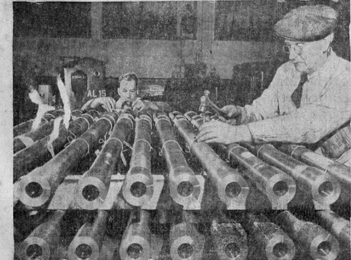
Cañones anti-aéreos canadienses son inspeccionados antes de salir para Inglaterra. El Canadá está enviando a Gran Bretaña grandes cantidades de armamento para la defensa inglesa.