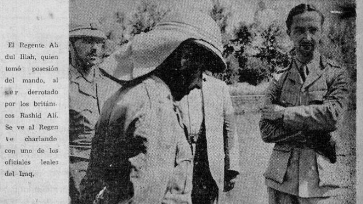
El Regente Abdul Iliah, quien tomó posesión del mando, al ser derrotado por los británicos Rashid Ali. Se ve al Regente charlando con uno de los oficiales leales del Iraq.