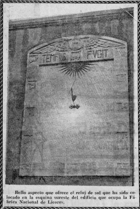
Bello aspecto que ofrece el reloj de sol que ha sido colocado en la esquina sureste del edificio que ocupa la Fábrica Nacional de Licores.

Este reloj es más un símbolo de exactitud y de justeza que una realidad