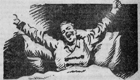
Un despertar alegre

LONDRES, 13. EP.— Los funcionarios británicos estiman que las bajas experimentadas por las fuerzas terrestres italianas en todo lo que va transcurrido de la guerra hasta el 30 de junio último exceden del medio millón, lo que se cree representa el 10 por ciento de sus efectivos generales. Las que sufrió la península como consecuencia de las acciones en Africa y en combatientes blancos en 241.000. Añaban se calculan para los prisioneros y en 135.000 por otros conceptos: muertos, heridos, desaparecidos y las de sus contingentes nativos en 69.000 y 137.000 respectivamente. Créese que el total de las fuerzas de línea de Italia antes de la guerra alcanzaban a 2.000.000, cifra que posiblemente se haya elevado a los 3 millones, con la convocatoria de las reservas. Las bajas británicas a lo largo de toda la guerra en Francia, los Países Bajos, Grecia, Creta y Africa se estiman en una quinta parte de las experimentadas por Italia o sean alrededor de un centenar de miles de hombres.