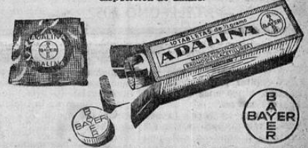
La ADALINA calma también los nervios

Las tabletas de ADALINA proporcionan un sueño sano, tranquilo y reparador, del que se despierta en perfecta disposición de ánimo.