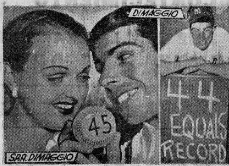
Joe DIMAGGIO le muestra a su bella esposa la pelota con que batío el record de todos los tiempos de Willie Keeler...