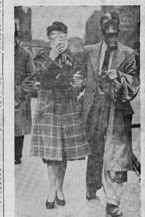
Los habitantes de Londres son constantemente aconsejados de no dejar olvidada en casa su máscara contra los gases cuando salen a la calle. En la foto vemos lo que le sucedió a una joven al oír la sirena que avisa contra los gases. Esta tuvo que usar su propio pañuelo.