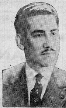
Dr. D. ARNULFO ARIAS

Los doctores Arias y Calderón Guardia se abrazan efusivamente en medio de las salvas de artillería y del entusiasmo DEL PUBLICO