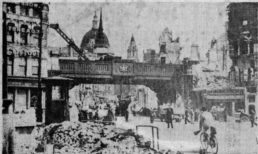
Sin preocuparse de las ruinas que los rodean, los habitantes de Londres continúan su vida diaria. En la foto vemos lo que ha quedado de la famosa calle Fleet de Londres, después de un reciente bombardeo.