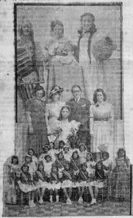
Recoge la gráfica tres aspectos de la hermosa fiesta celebrada ayer en la Escuela República del Perú, con motivo de la fiesta nacional peruana.