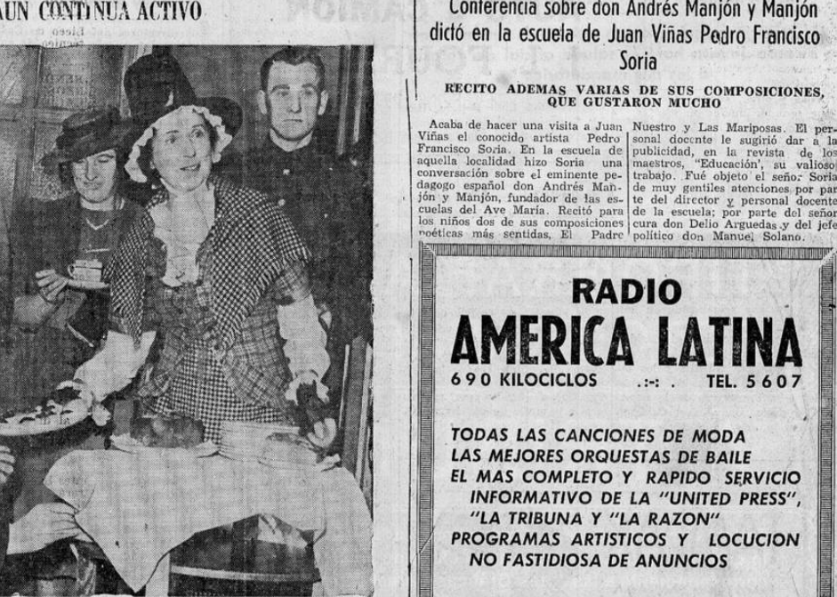
A pesar de su edad avanzada, Lloyd George, ex - Primer Ministro de Inglaterra durante la guerra pasada, asiste a las ceremonias de apertura de un club galés que acaba de inaugurarse en Londres para hombres y mujeres de dicha región.

SUSCRIBASE A "LA RAZON" AUN CONTINUA ACTIVO