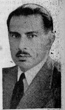
Lic. don TEODORO PICADO

El siguiente es el texto del discurso que pronunciara, al saludar en nombre del Congreso Nacional al Presidente Arias, el señor Presidente de la Cámara, licenciado don Teodoro Picado: Señor Presidente de la República: Con vuestra visita honráis y enaltecéis este recinto brindándome la oportunidad de saludaros del modo más deferente en nombre del Congreso de la República que con íntima satisfacción os acoge. Excelentísimo señor Presidente Arias: Vuestra presencia en el seno de la Representación Nacional Costarricense es sumamente grata para nosotros. Vuestras relevantes prendas personales, la altísima investidura que ostentáis con honra y con sobrados merecimientos así como vuestra juventud que a la par de la serenidad y la atinada prudencia (Pasa a la página 7)