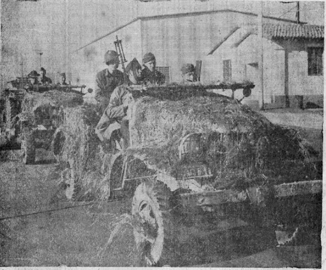
Durante sus recientes maniobras militares en Hunter Liggett, los carros blindados de las nuevas divisiones motorizadas de Estados Unidos operaron con el camuflaje que aparece en la foto, y que los hace invisible a su paso a través de los campos.

Por sobre todas las cosas hemos querido poner oídos al llamado a la concordia entre las naciones