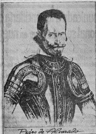
Pedro de Alvarado