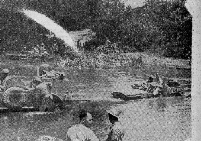
Carros blindados del ejército de Estados Unidos cruzando un río durante recientes maniobras militares. La infantería sigue a estos carros en grandes balsas y después que aquéllos han ocupado posiciones estratégicas.

La secretaria de fomento, se Juan de Tibás y Santo Domingo de Heredia, vía de comunicaciones anteriores resolvió iniciar la construcción de la carretera que ha de unir San (PASA a la página 5)