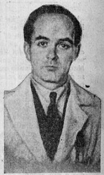
Dr. RAMON CASTROVIEJO

Al medio día, en el avión regular de la Panamerican, ingresó al país procedente de Panamá el Dr. Ramon Castroviejo.