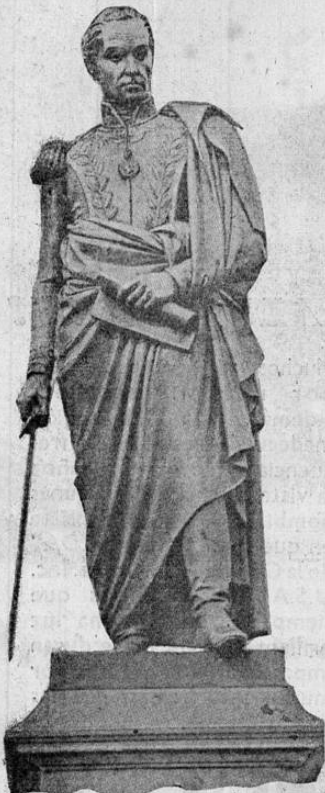
SIMON BOLIVAR PADRE DE LA DEMOCRACIA AMERICANA

Como los años anteriores, ayer 24 de julio, oficialmente titulado por el gobierno de Costa Rica del Libertador, se reunieron en la Cancillería los representantes de las repúblicas bolivarianas para hacer la ofrenda, con el señor Ministro de Relaciones Exteriores, de simbólicas coronas de laureles ante la estatua del héroe máximo de América, en el Parque Morazán.