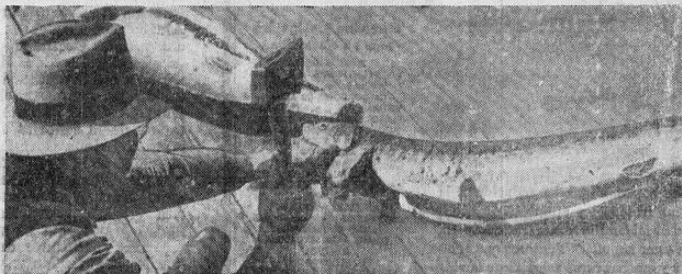
Una vez a bordo, el esturión es cortado primeramente a lo largo para sacarle los huevas y después cortado en pedazos. La extracción de los huevas tiene que hacerse inmediatamente después de haber sido pescado el esturión.