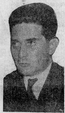
Mr. JACQUES SOUSTELLE

Tal como se había anunciado, es mañana, poco antes de las doce del día, por el avión regular del norte ingresó a esta capital Mr. Jacques Soustelle, enviado personal del general Charles de Gaulle. El señor Soustelle ha recorrido México, Guatemala, El Salvador, Honduras y Nicaragua, y es probable que de Costa Rica siga para Panamá. Tributósele un entusiasta y cálido recibimiento, preparado por las autoridades. — (PASA a la página CUATRO)