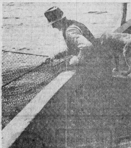
Pescador norteamericano se prepara para izar la red, en la que espera unos buenos ejemplares de esturión, los cuales a veces pasan de 200 libras de peso.

En las costas de España e Italia aparece también una especie de esturión que alcanza hasta 4 metros de longitud, pero no se explota comercialmente en grande escala.