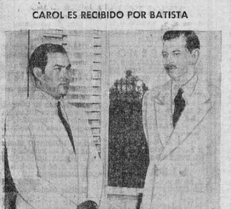
El ex-rey Carol de Rumania es recibido por el presidente Fulgencio Batista durante la visita de cortesía que aquel le hizo. El ex-rey de Rumania se halla como refugiado actualmente en Cuba.