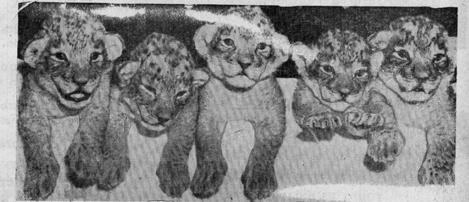
Princesa, una leona de seis años de edad de California dió a luz recientemente a esta bella colección de cachorros. Esta es ya la segunda serie de quintuples que ha tenido la leona en nueve meses.