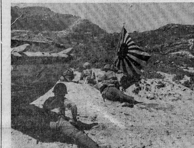
Fuerzas japonesas durante el ataque a un nido de ametralladoras chinas cerca de Lieng-Yun en la provincia de Kiang-Su, donde los japoneses han iniciado una ofensiva.

Este documento es propiedad de la Biblioteca Nacional "Miguel Obregón Lizano" del Sistema Nacional de Bibliotecas del Ministerio de Cultura y Juventud, Costa Rica.