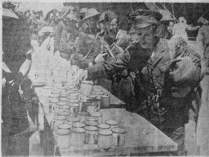
Las tropas británicas que se retiraron de Grecia, a juzgar por la foto, estaban en muy buen espíritu.