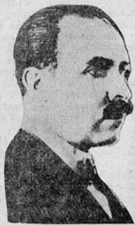
Excmo. señor Doctor Don Carlos A. Arroyo del Río, Presidente del Ecuador