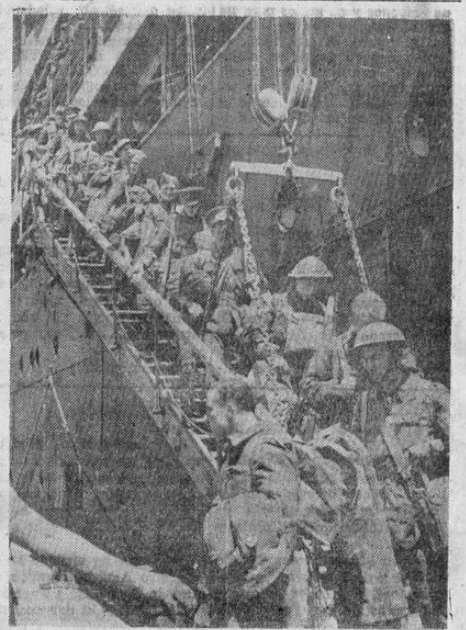
Desembarque de tropas británicas que se retiraron salvas de la guerra de Grecia

296 novillos, siendo la más grande de que se importa desde hace muchos meses, al país.